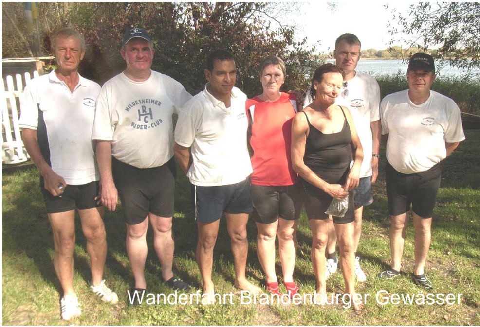
Wanderfahrt Brandenburger Gewässer

Aus dem Inhalt: Termine, Abrudern, Regattaergebnisse Jugend, Wanderfahrt Brandenburg, Neuwahl 1. Vorsitzender 2012